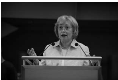
Staatsministerin Maria Böhmer

„Wir stehen integrationspolitisch vor großen Herausforderungen und es sind gerade auch die Stiftungen, die sich diesen Herausforderungen stellen. Sie tun eine Menge und das nicht erst seit heute“, mit diesen Worten begrüßte Staatsministerin Maria Böhmer auf der Eröffnungsveranstaltung am 25. Juni 2008 die rund 1.800 Stiftungsengagierte, die der Einladung des Bundesverbandes Deutscher Stiftungen zum Deutschen Stiftungstag gefolgt waren.