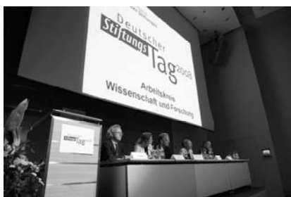
Podium des Arbeitskreises Wissens. & For.

Die in Wissenschaft und Forschung aktiven Stiftungen verständigten sich über die Integration europäischer Hochschulen durch den Bologna-Prozess. Stiftungen als Bildungs-Innovatoren waren Gegenstand des