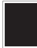
1/1 U4/U4 130 x 215 mm 1/1 Innenteil 130 x 215 mm