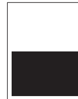
1/2 quer 130 x 105 mm